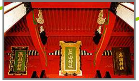
月山神社 出羽神社 湯殿山神社