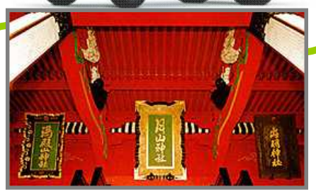
月山神社 出羽神社 湯殿山神社