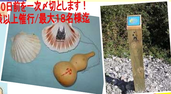
巡礼のシンボル"ホタテ貝殻と瓢箪 巡礼路の道標"

巡礼路は未舗装の部分が多いので、自転車の持ち込まれる場合は、MTB又はクロスをお薦めします!