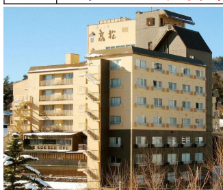
9/4泊 草津温泉 喜びの宿 高松