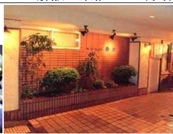
9/5泊 野沢温泉 ペンション魚安