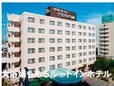
大浴場もあるルートインホテル